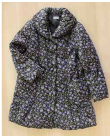
D/# 53-E/A (ゴルゴンダ) パープル/クロ