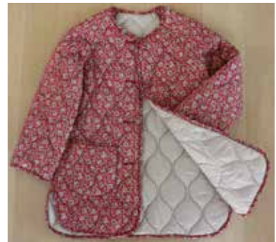
D/# 40-H (プルハンプール) アカ