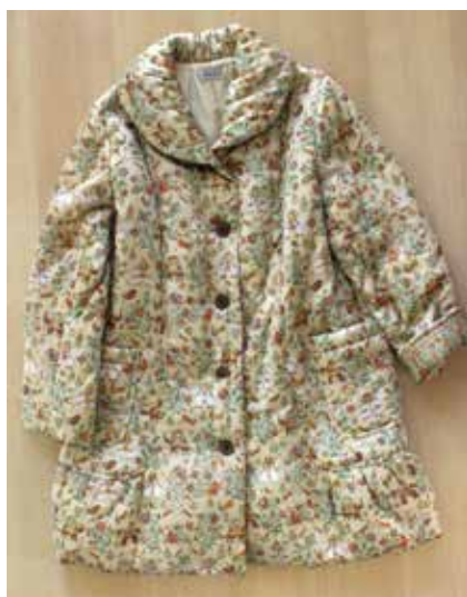
D/# 40-F (バローダ) ベージュ