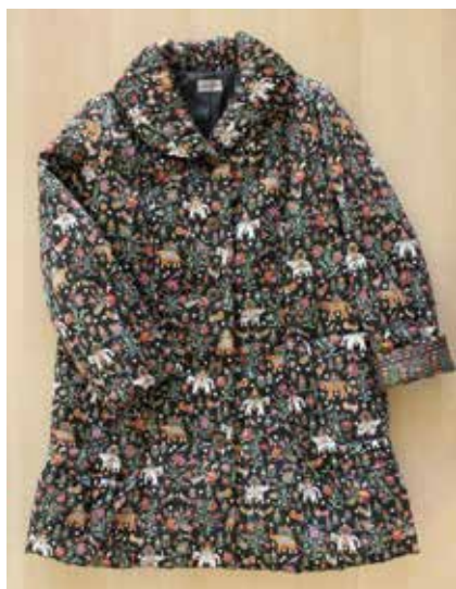
D/# 40-A (バローダ) クロ