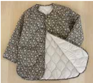
D/# 74-A (プルハンプール) クロ