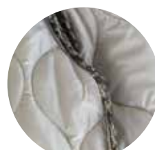
一重仕立て 共布パイピング仕立て