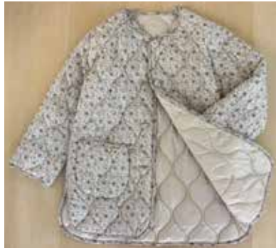
D/# 40-T (プルハンプール) ベージュ